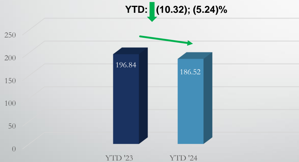
Revenue (in KWD Million)