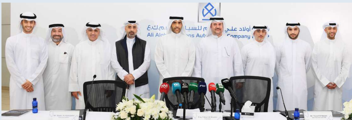
لقطة جماعية لمجلس الإدارة

تطوير مركزي خدمة جديدين محدثين ومجهزين بأحدث المرافق والتقنيات ليرتفع إجمالي عدد مراكز الخدمة إلى 18