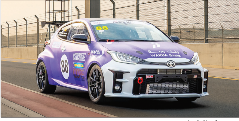
فريق «وربة» خلال السباق