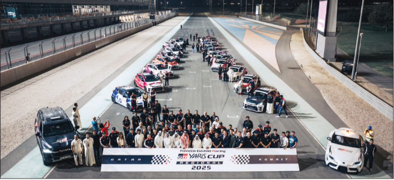
جانب من التكرير الختامي