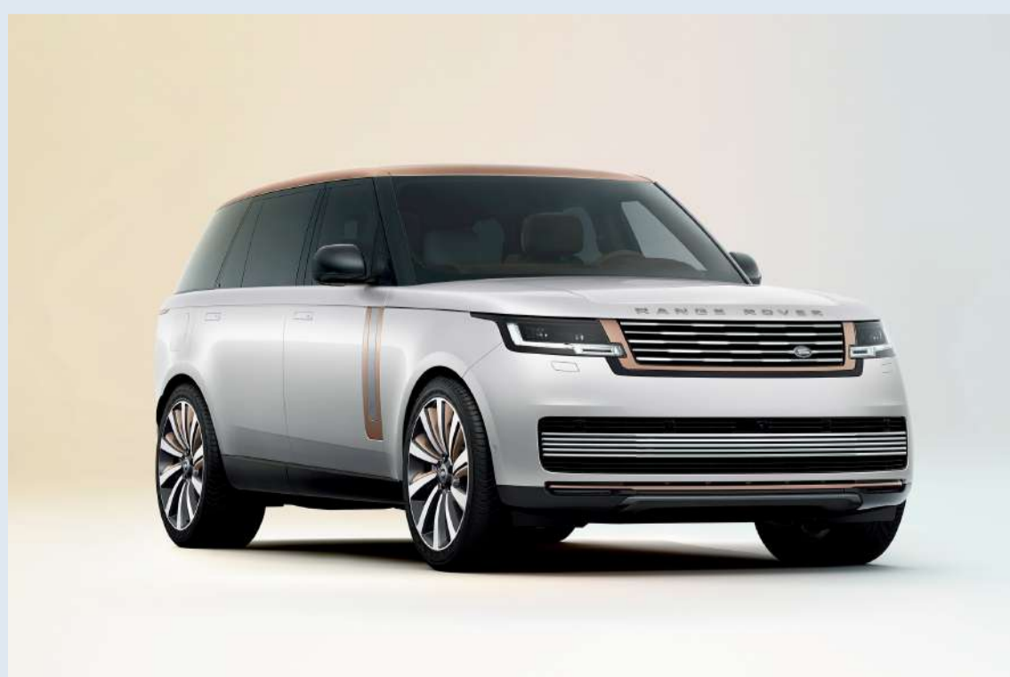
Range Rover SV_22MY

وسجلت الشركة بنهاية النصف الأول نمواً بأصولها الإجمالية بلغ 14.11% حيث قدرت تلك الأصول بـ 236.57 مليون دينار، فيما نمت حقوق المساهمين 8.01% عن الفترة المقابلة لتصل إلى 83.79 مليون دينار.