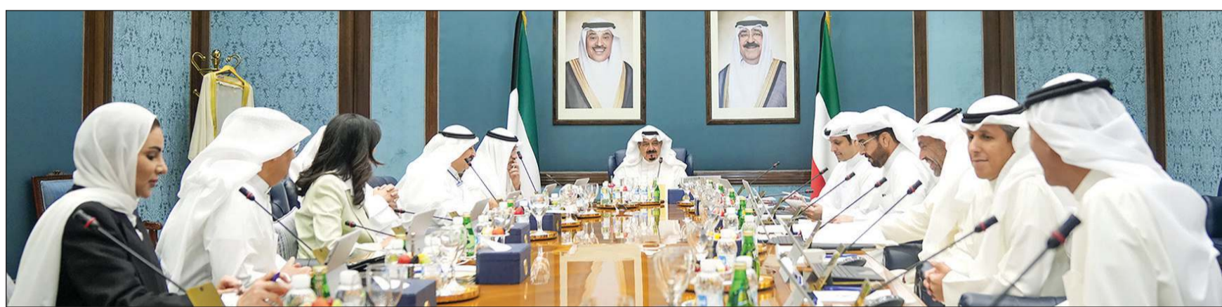
سمو الشيخ أحمد العبدالله مترئساً لاجتماع مجلس الوزراء أمس

الجهات الحكومية بما يضمن عدم استغلال تلك الإجازات خارج نطاق القانون واللوائح. وقرر مجلس الوزراء تشكيل لجنة برئاسة وزير الخارجية بشأن كل ما يتعلق بتنفيذ الاتفاقيات ومذكرات التفاهم بين دولة الكويت وجمهورية الصين الشعبية التي تم توقيعها في عام 2023 بشأن التعاون بين البلدين في مجالات المنظومة الخضراء منخفضة الكربون وإعادة تدوير النفايات، والبنية التحتية البيئية لحطات معالجة مياه الصرف الصحي، ومنظومة الطاقة الكهربائية وتطوير الطاقة المتجددة، ومشروع ميناء مبارك، والمناطق الحرة الاقتصادية، إضافة إلى التطوير الإسكاني.