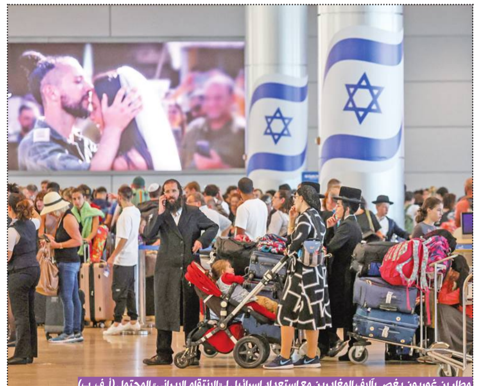
مطار بن غوريون يفص بألاف المغادرين مع استعداد إسرائيل لـ«الانتقام الإيراني» المحتمل (أ. ف. ب.)

وأعلن المكتب إحصائية أمس تضمنت تفاصيل خسائر العدوان المستمر على القطاع، وأحصى المكتب، قرابة 10,000 مفقود، و885 شهيداً من الطواقم الطبية، و79 شهيداً من الدفاع المدني، و165 شهيداً من الصحفيين. وبين المكتب، أن الاحتلال أقام 7 مقابر جماعية داخل المستشفيات، حيث تم انتشار 520 شهيداً من تلك 02#