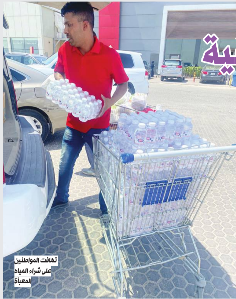
تهافت المواطنين على شراء المياه المعبأة

صفاء الماء في منازلهم الأمر الذي جعلهم يتهافتون على شراء قناني المياه المعبأة حتى خلت أرفقها في المجمعات والأسواق المركزية منها.