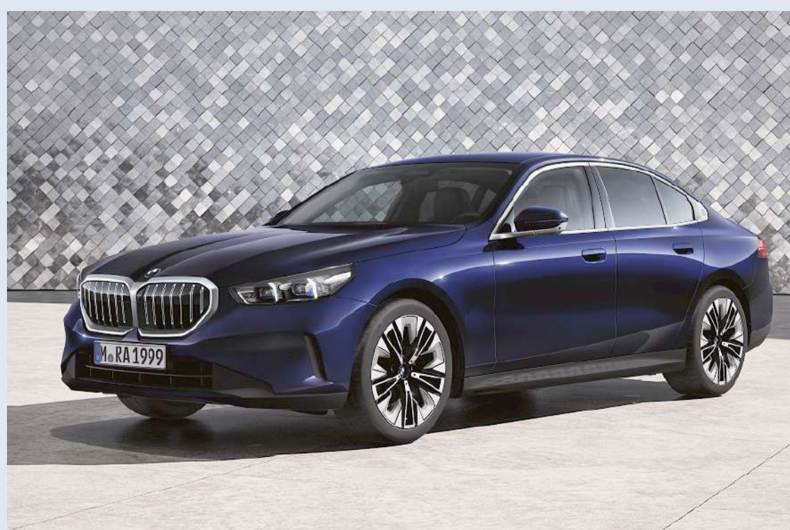
BMW 5 Series