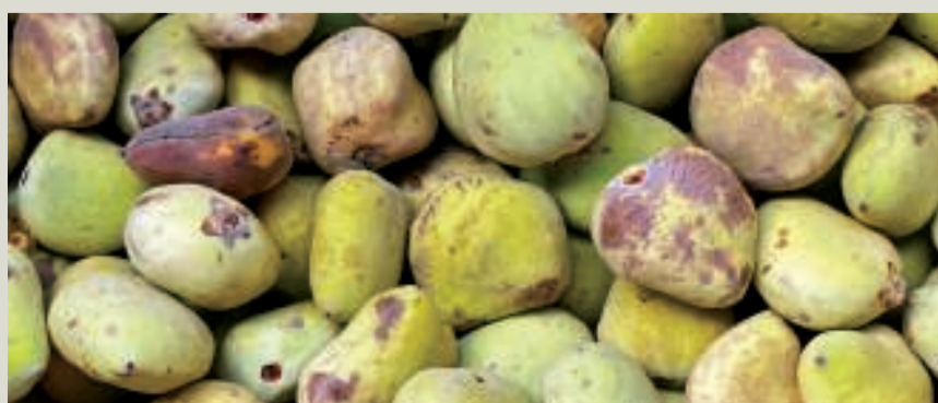
بذور القرم التي أهدتها عُمان للكويت