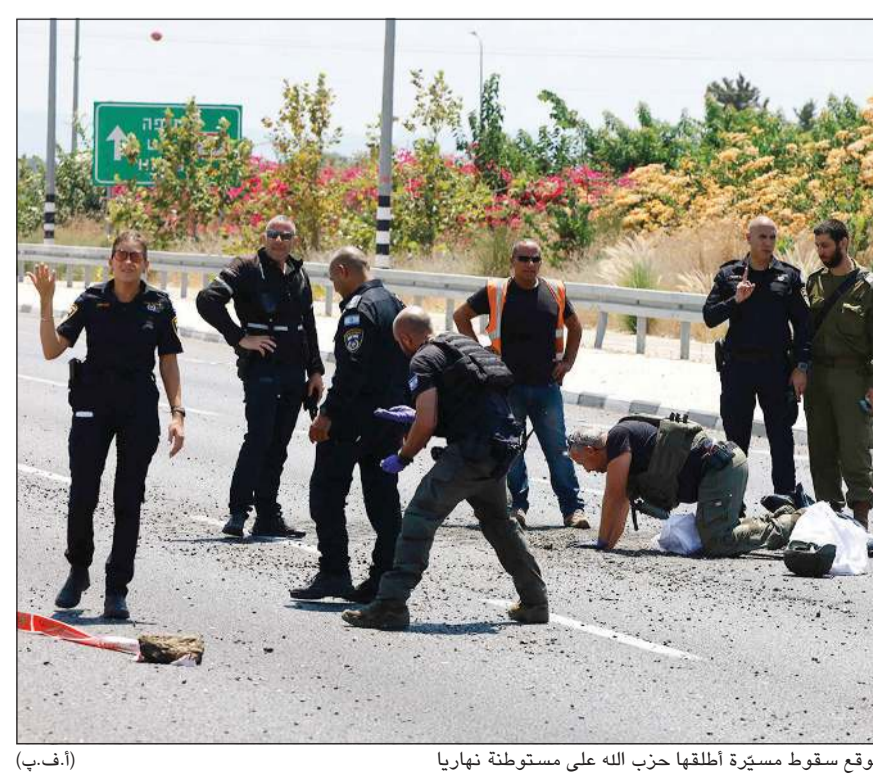
موقع سقوط مسيرة أطلقها حزب الله على مستوطنة نهاريا (إ.ف.ب)

عواصم - وكالات: يخوض المجتمع الدولي سباقاً مع الزمن لمواجهة التصعيد العسكري بين إيران وحلفائها من جهة، وإسرائيل من جهة أخرى، حيث أكدت واشنطن أنها تعمل «ليل نهار» لمنع تحولها إلى حرب إقليمية. وعقد الرئيس الأميركي جو بايدن ونائبته كامالا هاريس وأعضاء مجلس الأمن القومي اجتماعاً طارئاً في البيت الأبيض، طالب خلاله وزير الخارجية الأميركي أنتوني بلينكن بوقف لإطلاق النار في قطاع غزة حيث أدت الحرب إلى حلقة عنف في الشرق الأوسط. وقال بلينكن عقب الاجتماع «نحن منخرطون في دبلوماسية مكثفة ليل نهار لتوجيه رسالة مفادها أنه على جميع الأطراف الامتناع عن التصعيد». وأعلن أصغر جهانجير، المتحدث باسم السلطة القضائية الإيرانية، أن «التحقيقات اللازمة بدأت» عقب اغتيال إسرائيل لرئيس المكتب السياسي لـ «حماس» إسماعيل هنية في طهران. وأكد «حتى الآن لم يتم أي اعتقال في هذه القضية» مشيراً إلى أن التحقيقات تشمل مسؤولين عسكريين إيرانيين. من جهتها، أعلنت «حماس» تعيين يحيى السنوار رئيساً للحركة خلفاً لهنية الذي اغتيل مؤخراً في طهران. والسنوار اعتقلته إسرائيل عدة مرات وحكمت عليه بـ 4 مؤبدات، وتعتبره مهندس هجوم 7 أكتوبر الماضي. هذا، ورغم الجهود الدولية، امتدت شرارة التوتر إلى العراق حيث أصيب أميركيون بقتل صاروخي استهدف قاعدة عين الأسد العسكرية في العراق. وفي غضون تواصل القصف المتبادل في جنوب لبنان وشمال إسرائيل حيث أعلنت مصادر طبية إصابة 17 شخصاً في انفجار مسيرة لحزب الله بالجليل الغربي بينهم حالة خطيرة.