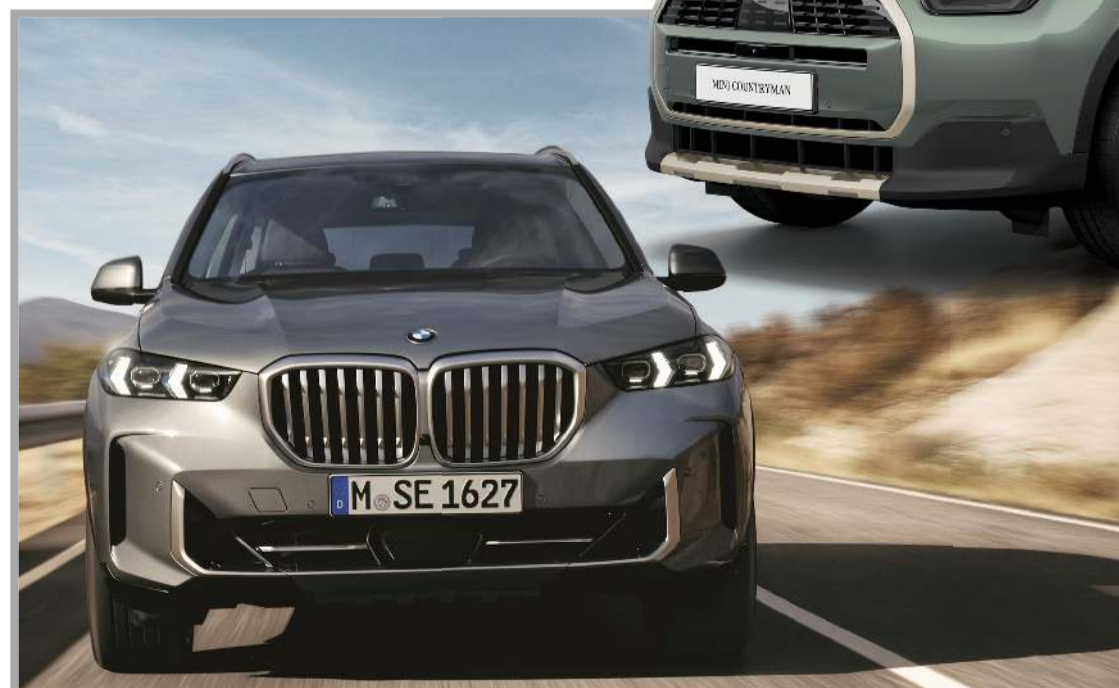
BMW، طراز X5