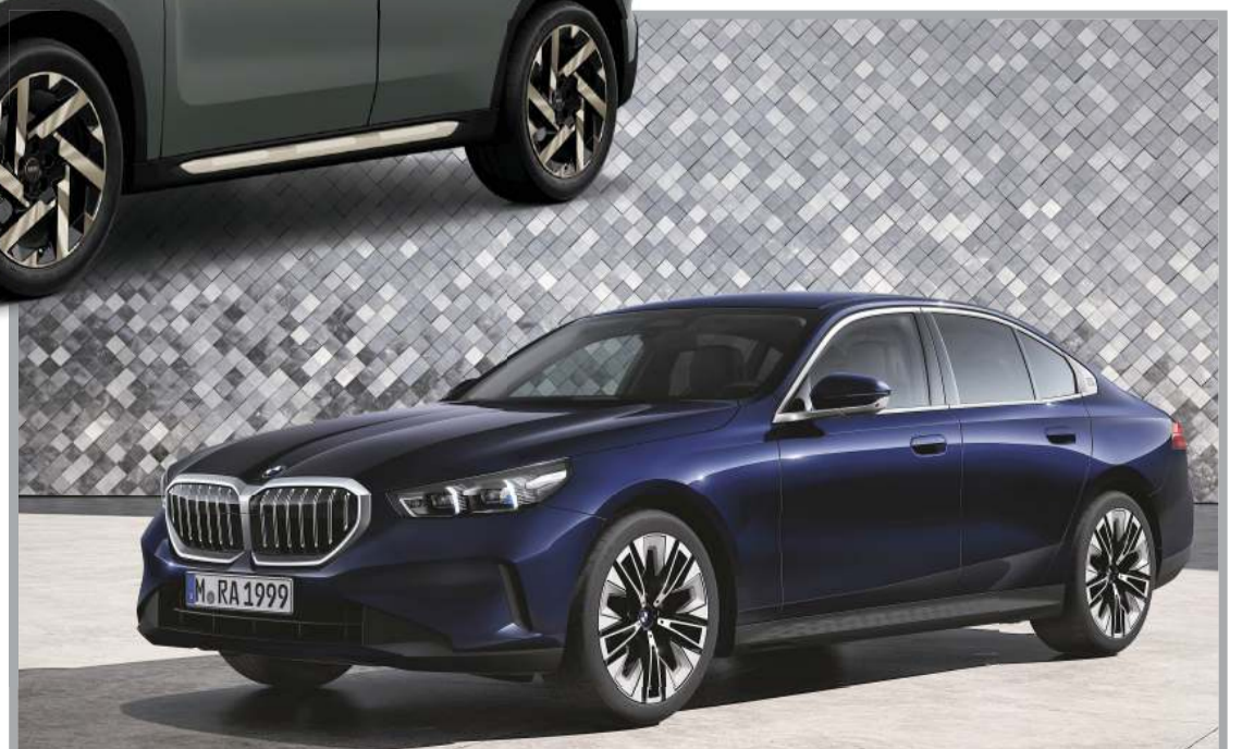
BMW، الفئة الخامسة