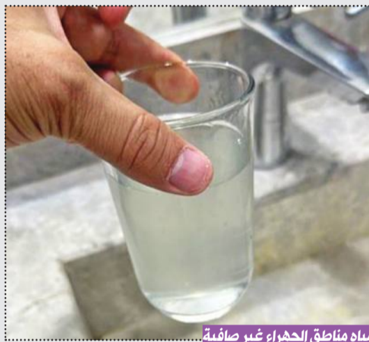
مياه مناطق الجهراء غير صافية